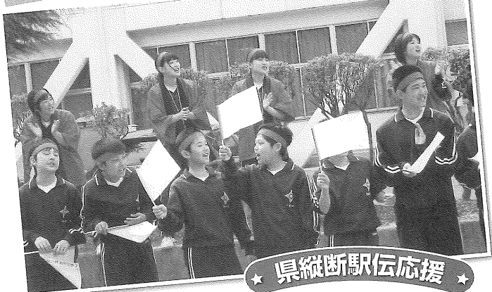
★ 県縦断駅伝応援 ★