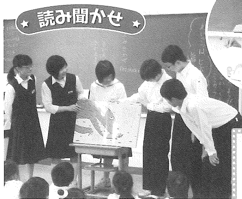
★ 読み聞かせ ★